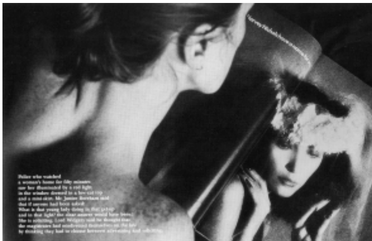
Victor Burgin, UK 76 , 1976. Fotografía en Blanco y negro con texto montado.